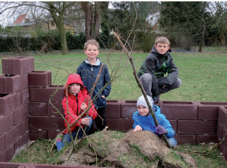
Schüler der AG „Lernen im Grünen“